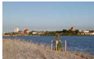
. . . nagelneu - der Strand am Binnensee.