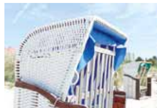
Machen Sie es sich gemütlich.

Höchstabgabedauer ist 28 Tage. Bei Schwerbehinderten, die eine Behinderung von 80% und mehr % nachweisen, ermäßigt sich der Tourismusbeitrag um die Hälfte (50%), dasselbe gilt auch für die erforderliche Begleitperson. Schülern, Studenten und Auszubildenden ab 18 Jahren bis zu 26 Jahren wird gegen Vorlage von Ausweisen oder Ausbildungsverträgen eine Ermäßigung von 50% gewährt. Die Kurabgabe wird beim Vermieter entrichtet. Für die Kurabgabezahlung erhalten Gäste die Ostseecard.