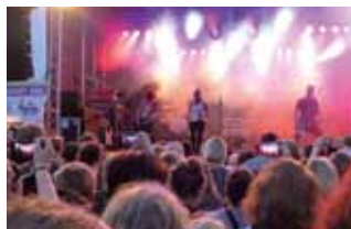
Hafenfesttage Heiligenhafen: Spiel und Spaß und Musik. Hier die Hafenbühne.

14:00-18:30 Uhr Großenbrode Jumicar Ostholstein