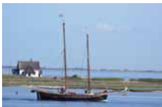
Traditionssegler vor dem Graswarder.

Ostsee-Clown Der Ostsee-Clown kommt! Musik und Theater für die ganze Familie.