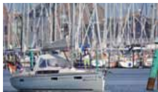
Einlaufen und das abendliche Flair des Hafens genießen.