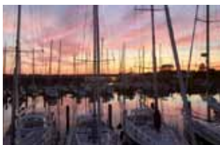
Abendstimmung im Yachthafen . . .