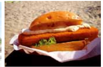
Vielleicht mit einem leckeren Fischbrötchen?