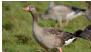
Wie diese Graugänse, die im Naturschutzgebiet Graswarder fotografiert wurden.

14:00-17:00 Uhr Großenbrode Südstrandcenter