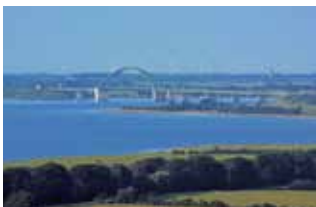
Die Fehmarnsunbrücke vom Klausdorfer Turm aus gesehen.