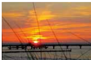
und an der Seebrücke in Großenbrode.