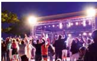
Promenadenfest oder ...

10:00-11:00 Uhr Heiligenhafen Pavillon am Binnensee Morgengymnastik Ein aktiver Start ist die beste Voraussetzung für einen guten und erfolgreichen Tag. Das Heiligenhafener Trainer-Team zeigt Ihnen lockere Übungen, die Ihre Lebensgeister wecken und Sie frisch in den neuen Tag starten lassen.