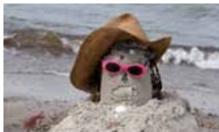
Die Seeluft beflügelt auch die Kreativität. . . . . und bringt Originelles hervor.