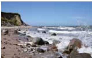
Uralt - die Steilküste . . .