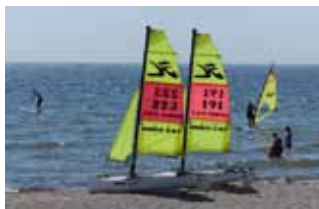
Spaßsegler am Strand von Großenbrode.