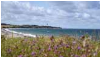
Erkunden Sie die OstseeSpitze und entdecken Sie die herrliche Flora und Fauna.