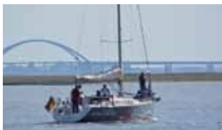
Auslaufen und einen schönen Tag auf der Ostsee verbringen.

17:00 Uhr Großenbrode Meerhuus Ferienkino Ferienkino im Meerhuus! Titel und Preis entnehmen Sie bitte den aktuellen Aushängen.