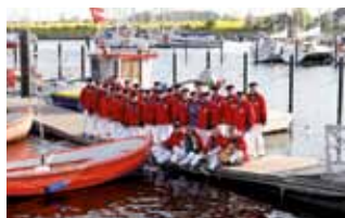
Shanties. Für jeden ist etwas dabei.