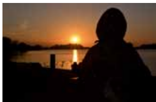
Die Statue von Fischer Stüben bei Sonnenuntergang

18:00-19:00 Uhr Großenbrode MeerBühne Kinderparty Die Animatoren werden gemeinsam mit den DJ's die Kids zu Höchstleistungen animieren und dabei jede Menge Spaß und Freude vermitteln.